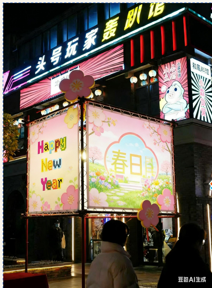
改造参考示意图AI生成需深化