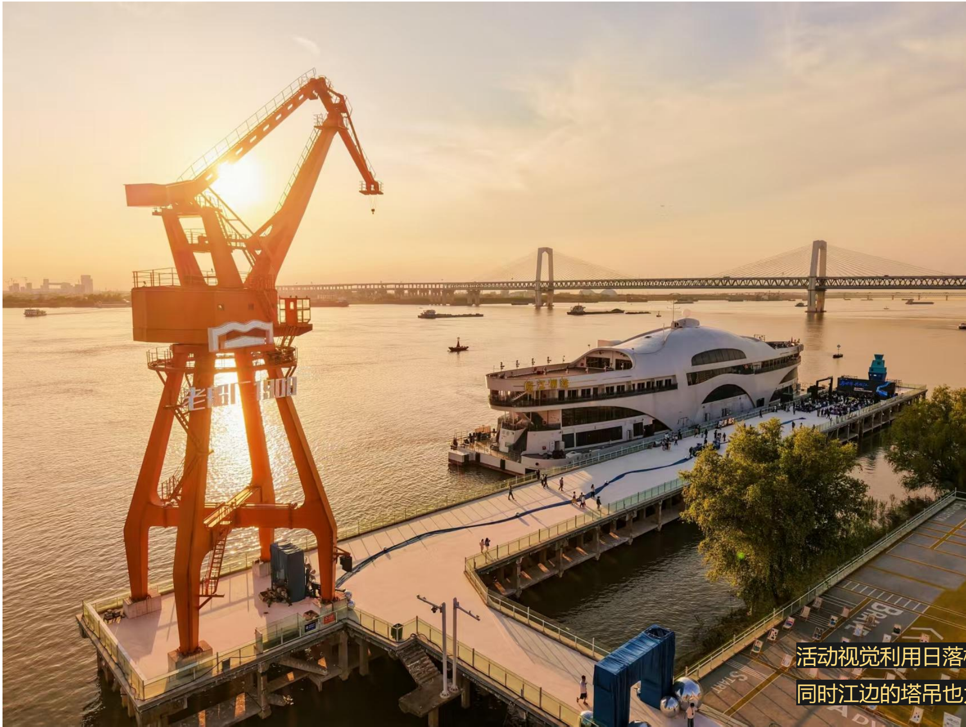
活动视觉利用日落橙为主题颜色 同时江边的塔吊也为橙色