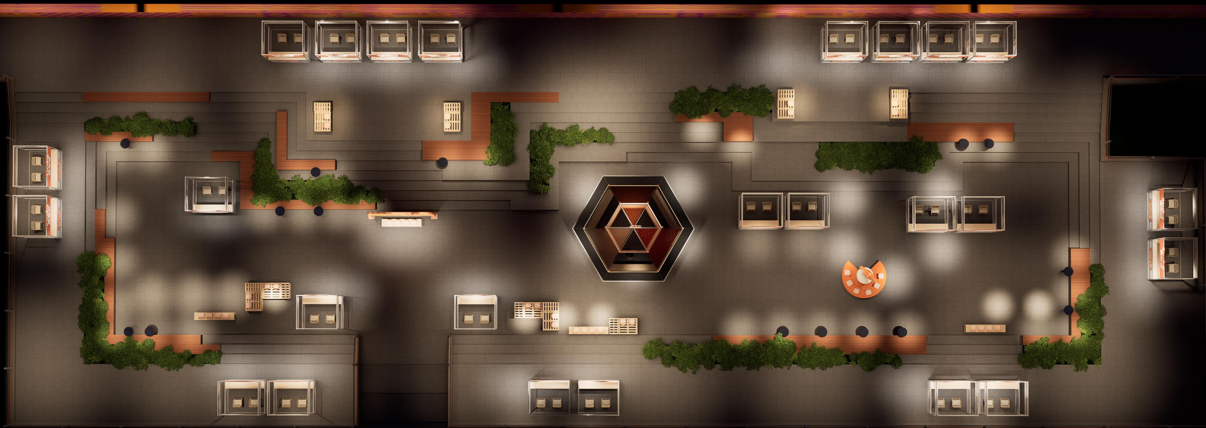
小广场日落微醺市集平面图