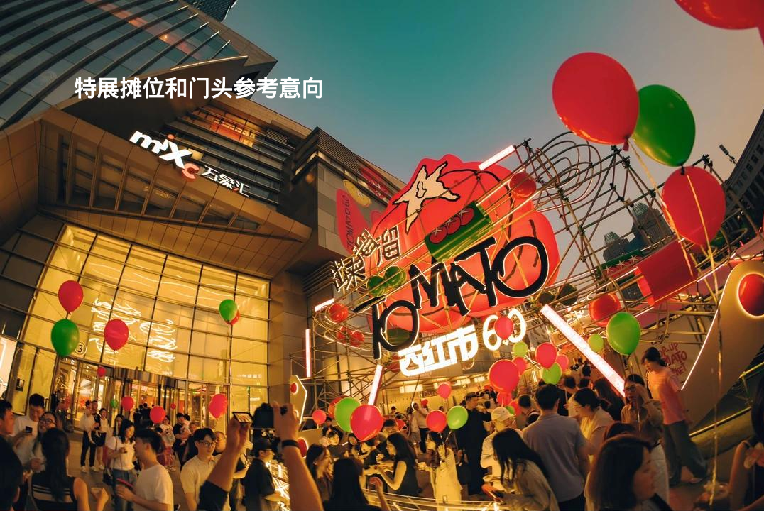
特展摊位和门头参考意向