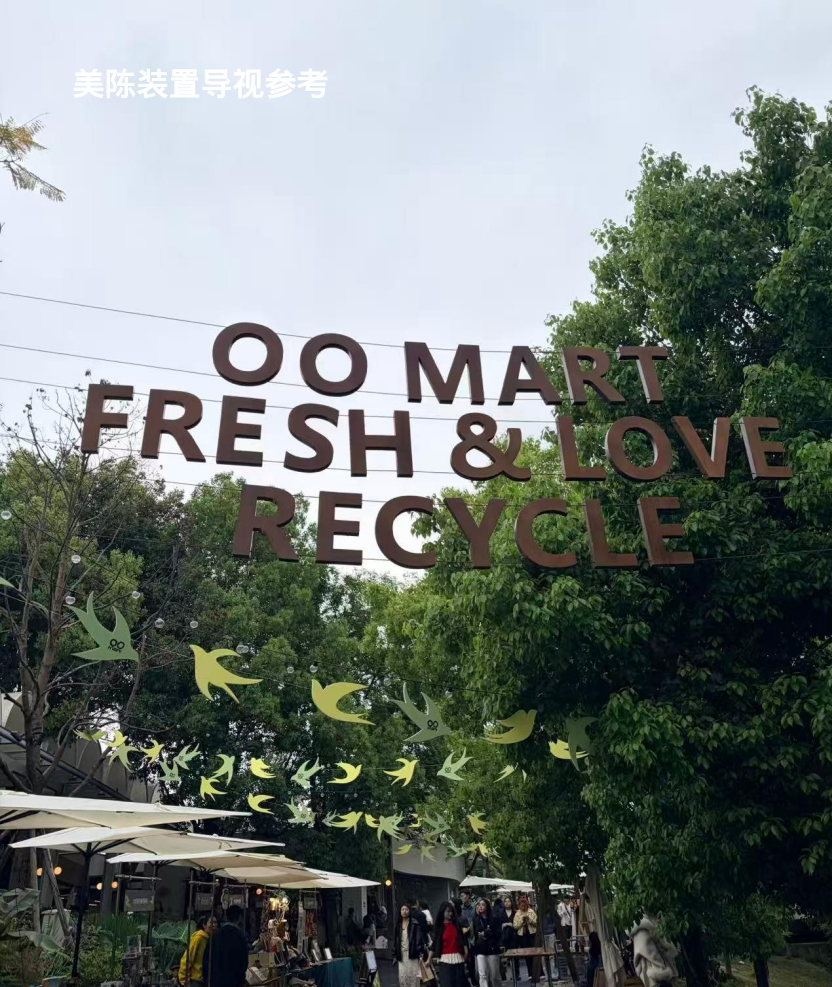
美陈装置导视参考